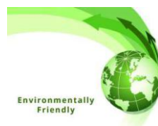
SEM WATER SHIELD®

WATER SHIELD® é um produto ecologicamente correto e amigável.